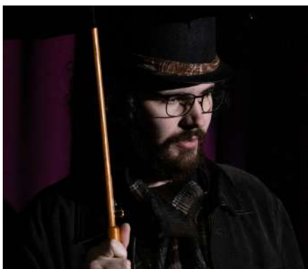
FABRICE RICHEBÉ COMÉDIEN